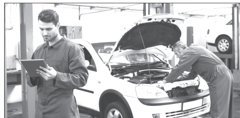
Техосмотр автомобилей перестал быть обязательным

Теперь техосмотр становится обязательным при постановке автомобиля на учет, либо при смене владельца, если возраст машины превышает четыре года, либо при внесении изменений в конструкцию автомобиля.