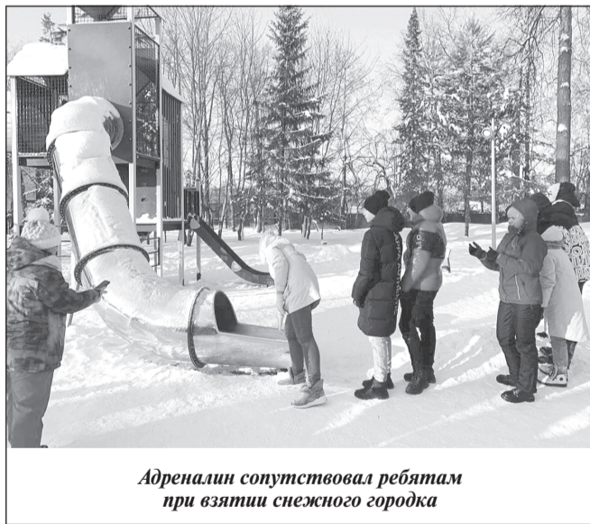
Адреналин сопутствовал ребятам при взятии снежного городка

I место завоевал ВПК «Юный десантник», II место — КБЕ «Витязь» и III место у «Нового рубежа».