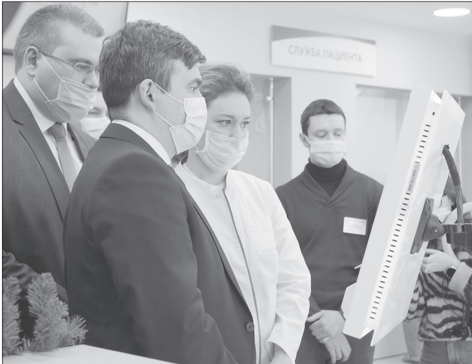
Губернатор Ивановской области Станислав Воскресенский ознакомился с работой обновленной клиники.

Обновленная клиника «РЖД-Медицина» в Иванове открыла двери после масштабной реконструкции и сможет принимать до 500 пациентов в смену.