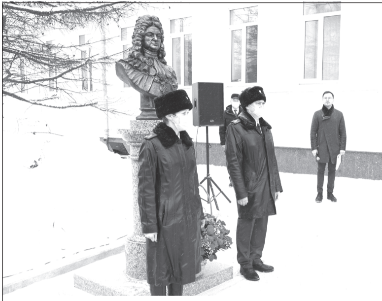
Церемония открытия памятника первому генерал-прокурору России

Памятник первому генерал-прокурору России Павлу Ягужинскому открыли уздания областной прокуратуры на проспекте Ленина в Иванове. В мероприятии вместе с сотрудниками надзорного ведомства, общественностью принял участие губернатор Станислав Воскресенский.