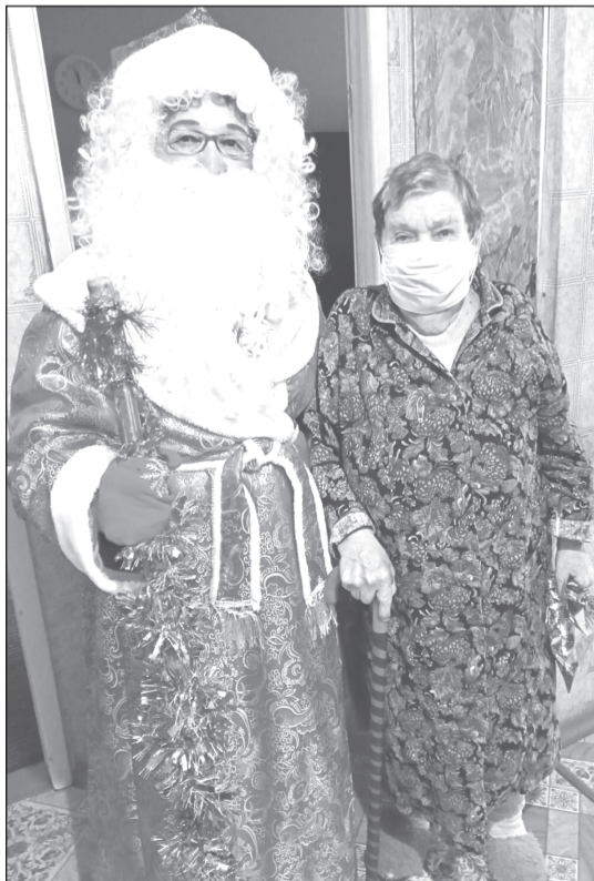
Встрече с Дедом Морозом радуется и стар, и млад

В с. Горки-Чириковы были организованы посещения одиноких пенсионеров с вручением им новогодних сувениров. Посещения граждан проходили с соблюдением всех противоэпидемических мер.