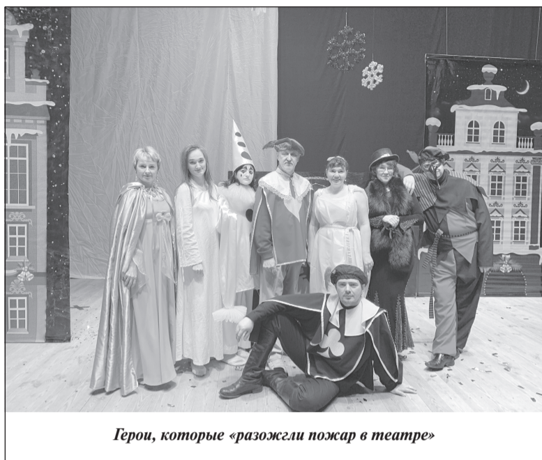
Герои, которые «разожгли пожар в театре»

Как Вы думаете, что общего между музыкальной комедией Яна Фрида «Сильва», рок-оперой А. Рыбникова «Юнона и Авось», Айседорой Дункан, балетом Р.М. Глиэра «Красный мак», картиной Марка Шагала «Влюблённые», Владимиром Маяковским, пьесой Марины Цветаевой «Метель» и романом Михаила Булгакова «Мастер и Маргарита»? Не догадываетесь?