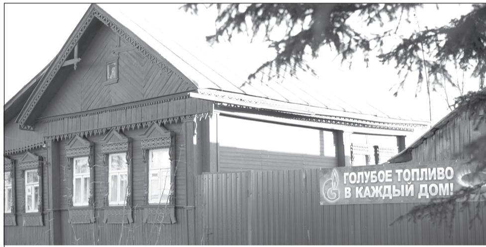
К настоящему моменту уровень газификации в целом по Ивановской области составляет 77,56%.

Программой развития газоснабжения и газификации региона на ближайшие пять лет также предусмотрен еще один важный этап – природный газ получат два района, в которых газа не было вообще, – Лухский и Пестяковский, а также Верхнеландеховский район, где сейчас газифицирован всего один населенный пункт.