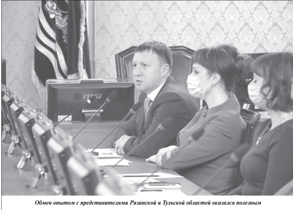
Обмен опытом с представителями Рязанской и Тульской областей оказался полезным