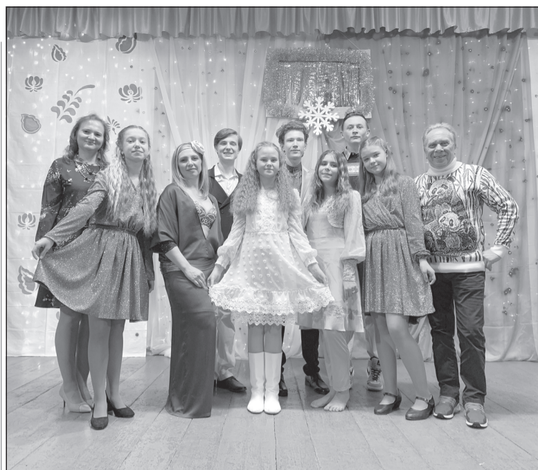
Юные «звездочки» на сцене санатория «Плёт»